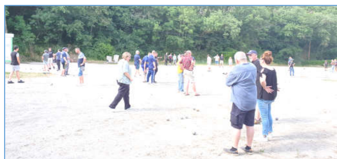
Un terrain bien occupé par les 40 doublettes

Ce sont 40 doublettes qui se sont affrontées. De nombreuses doublettes saint romaines étaient présentes et c'est finalement une victoire d'une doublette givordine/grignerotte qui s'est dessinée en fin de journée.