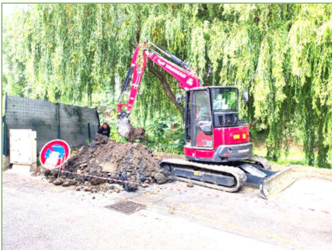
Sondage à la pelle au bas du village

Attention, en dehors de ces dates, le dépôt de pneus n'est pas autorisé dans les déchèteries