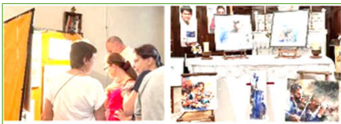
Eglise de Saint Romain en Gier pendant la journée du patrimoine.

Au plaisir de se rencontrer bientôt, Belle rentrée à chacun et chacune !