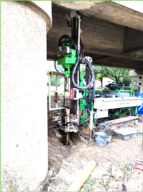
Sondage à la carotteuse sous le pont