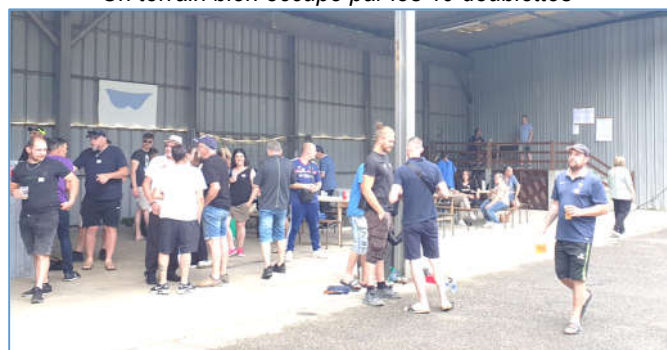
Tout comme la buvette