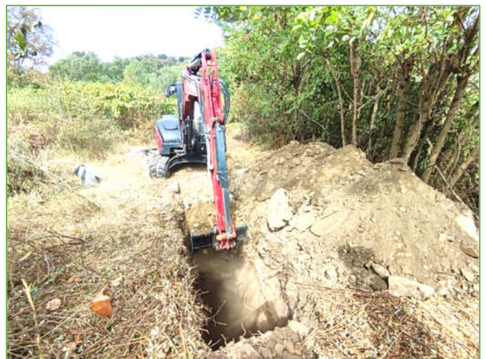
Sondage à la pelle sur l'ancien garage

Tout ceci avec comme objectif de démarrer les 1 ers travaux en fin d'année 2024