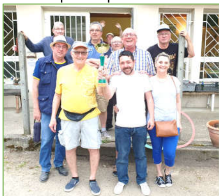
Les vainqueurs de la coupe

Forte d'une quinzaine d'équipe, c'est la fine fleur de la pétanque saint romanaise qui s'est affronté dans le tournoi le plus important de l'amicale.