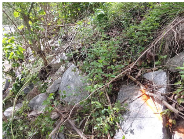
Marquage fluo sur les berges du gier

En pleine mise à jour du Plan Communal de Sauvegarde (PCS), cet épisode nous a permis de tester notre Plan en grandeur réelle et l'affiner.