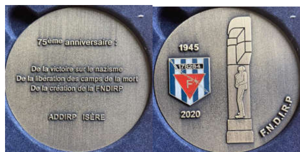
Médaille du 75ème anniversaire remis à la mairie